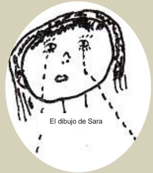
El dibujo de Sara